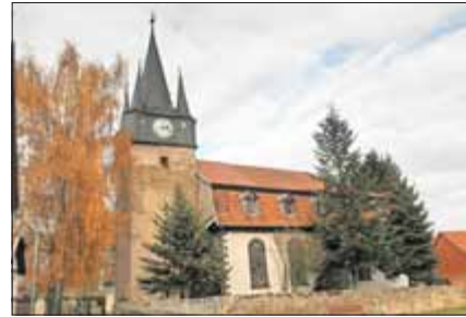
Die Bonifatiuskirche zu Holzsußra

Siehe, ich bin bei euch alle Tage bis an der Welt Ende. Mt. 28,20